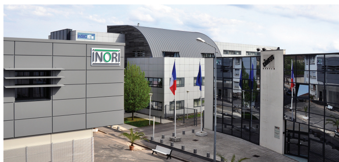
CIRTES, INORI et InSIC sur le pôle VirtuReal® à Saint-Dié-des-Vosges.