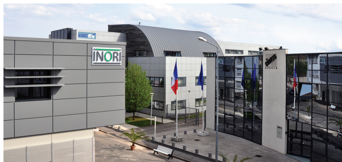
CIRTES, INORI et InSIC sur le pôle VirtuReal® à Saint-Dié-des-Vosges.