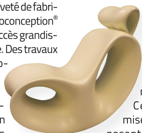
Maquette de fauteuil d'avion par Stratoconception® PS pour EAD Aerospace.

une plateforme technologique de 8000 m 2 .