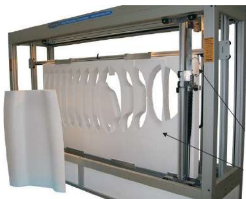
Machine spéciale 4 axes de découpe au fil chaud de couches